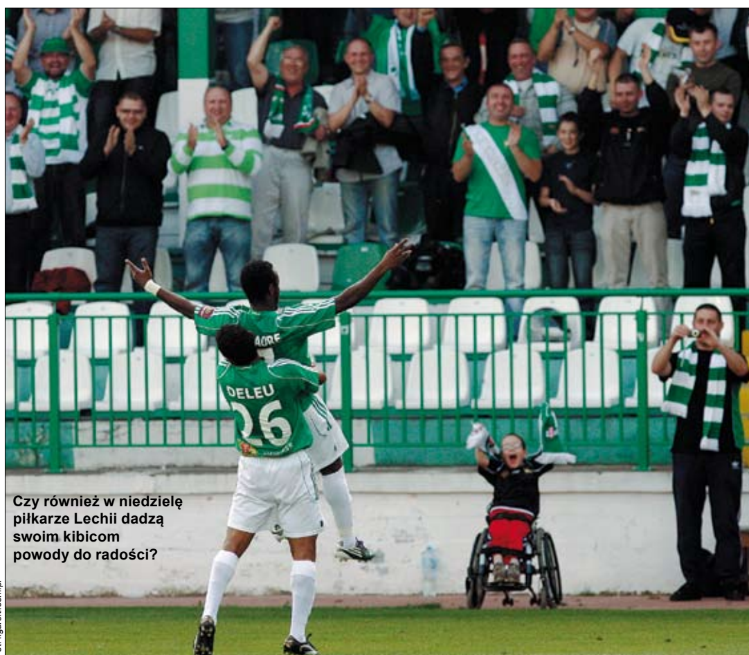
Czy również w niedzielę piłkarze Lechii dadzą swoim kibicom powody do radości?

Wszystkie te statystyki będzie można odrzucić na bok, gdy doj-