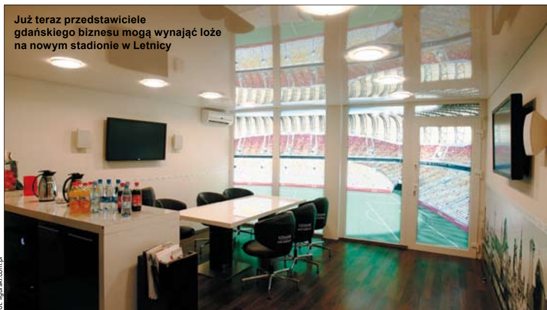
Już teraz przedstawiciele gdańskiego biznesu mogą wynająć łóż na nowym stadionie w Letnicy

Na obiekcie umiejscowionych będzie 40 łóż. Cztery z nich zostały już zarezerwowane przez sponsora tytularnego – firmę PGE, miasto Gdańsk, spółkę BIEG 2012 oraz klub. Resztę można wynająć. Minimalnie na jeden, maksymalnie na trzy sezony. Ceny są zróżnicowane. Zależą od formy płatności, a ci, którzy zaproponują najlepsze warunki, mogą liczyć na atrakcyjne rabaty. Niemniej wartość łóż waha się od 172 do 432 tys. zł za sezon użytkowania. Osiem łóż jest więk-