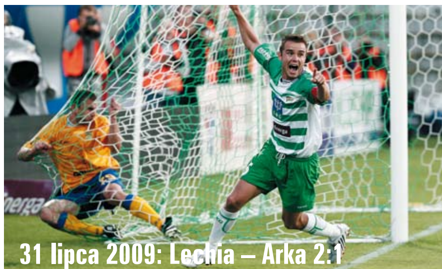
31 lipca 2009: Lechia – Arka 2:1