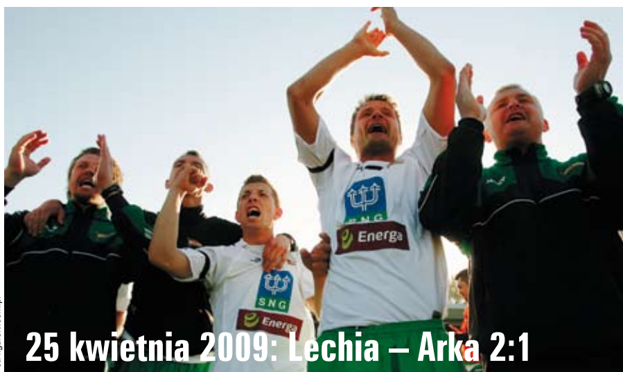
25 kwietnia 2009: Lechia – Arka 2:1