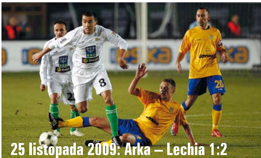
25 listopada 2009: Arka – Lechia 1:2