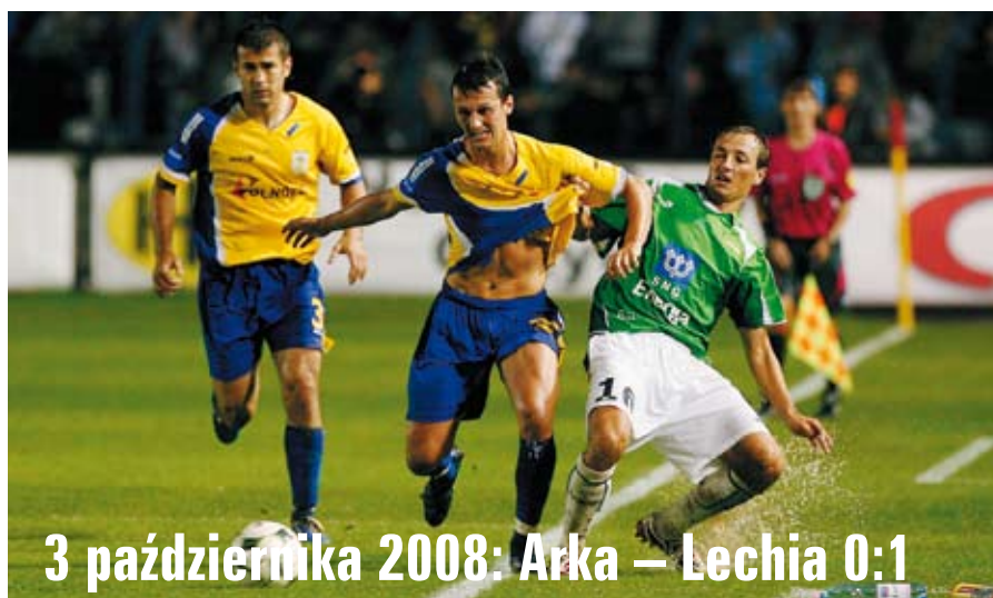
3 października 2008: Arka – Lechia 0:1

WIELKIE DERBY TRÓJMIASTA Lechia Gdańsk – Arka Gdynia niedziela, 17 października, godz. 17.15