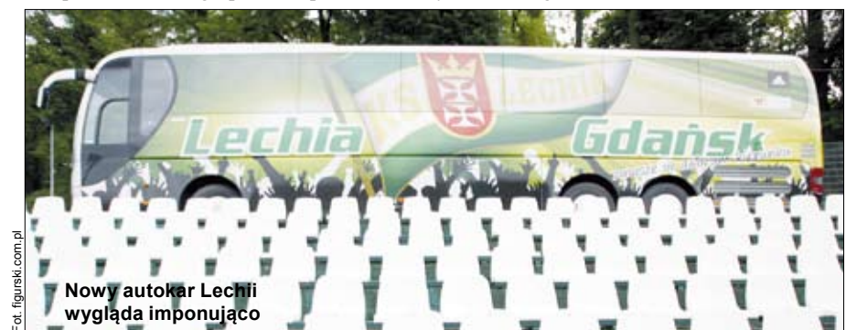
Nowy autokar Lechii wygląda imponująco