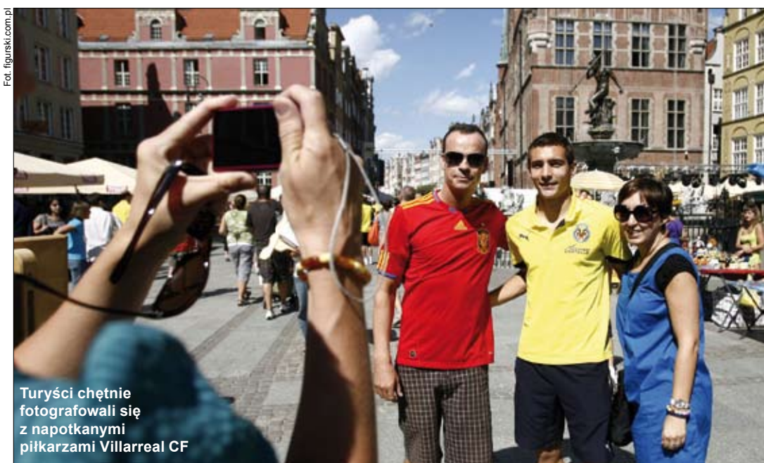
Turyści chętnie fotografowali się z napotkanymi piłkarzami Villarreal CF