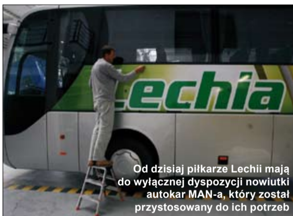
Od dzisiaj piłkarze Lechii mają do wyłącznej dyspozycji nowiułki autokar MAN-a, który został przystosowany do ich potrzeb

Autokar będzie służył głównie drużynie Ekstraklasy oraz ekipie Młodej Ekstraklasy, które jeżdżą po całym kraju. Na potrzeby trzecioliżowego zespołu rezerwy i grup młodzieżowych Lechii będą natomiast