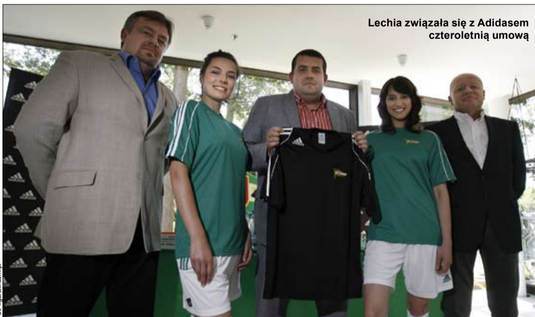
Lechia związała się z Adidasem czteroletnią umową